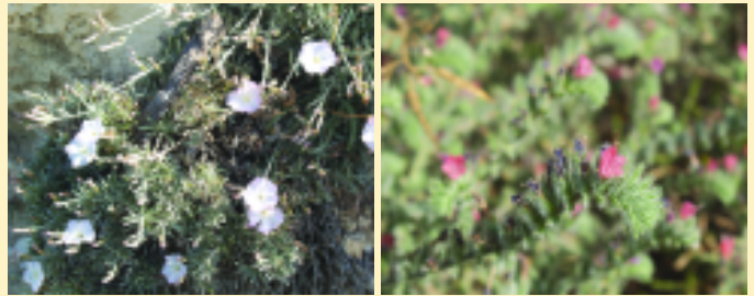
Περπλοκάδι ( Convolvulus oleifolius ) Καπουδικιά ( Echium angustifolium )