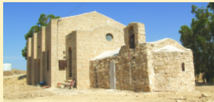
Εκκλησία Προφήτη Ηλία