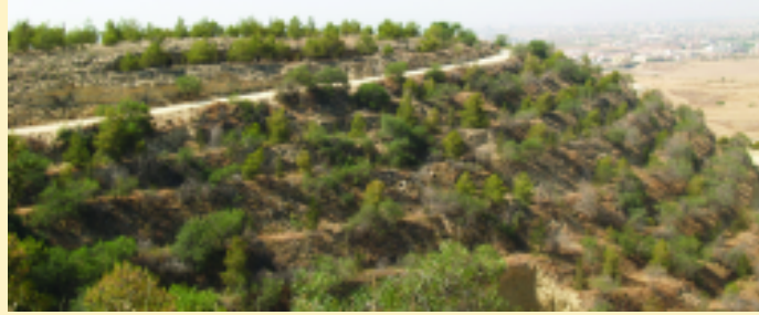
Το Δάσος Βορόκλινης

Το έδαφος είναι αμμοαργιλώδες και προέρχεται κυρίως από ψαμμιτικό ασβεστόλιθο.