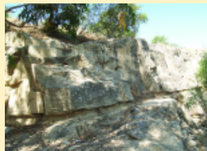
“Παδικές του Αγίου”

Το μονοπάτι στο μεγαλύτερο μέρος του ακολουθεί πορεία κατά μήκος του υψώματος που δεσπόζει του χωριού Βορόκλινη και προσφέρει στον περιπατητή πανοραμική θέα του